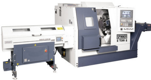
Produktbild: SPINNER Werkzeugmaschinenfabrik GmbH